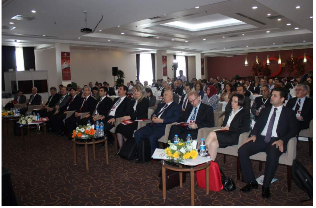
Çalıştay Açılış Toplantısı