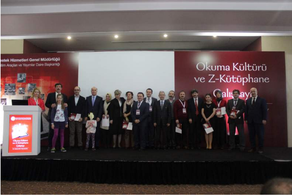
Çalıştay Sonrası Katılım Belgesi Dağıtım Töreni