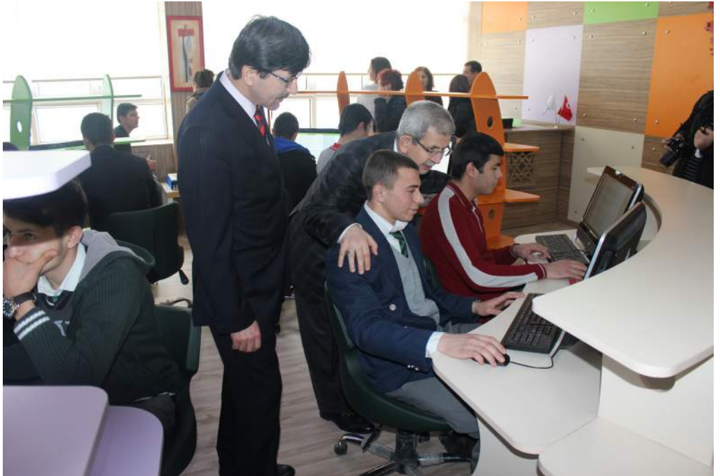
Z-Kütüphane Ziyareti – Afyon