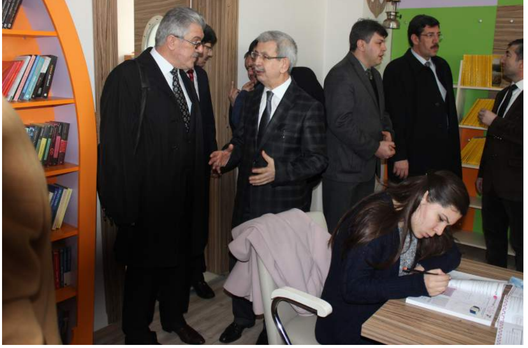
Z-Kütüphane Ziyareti – Afyon