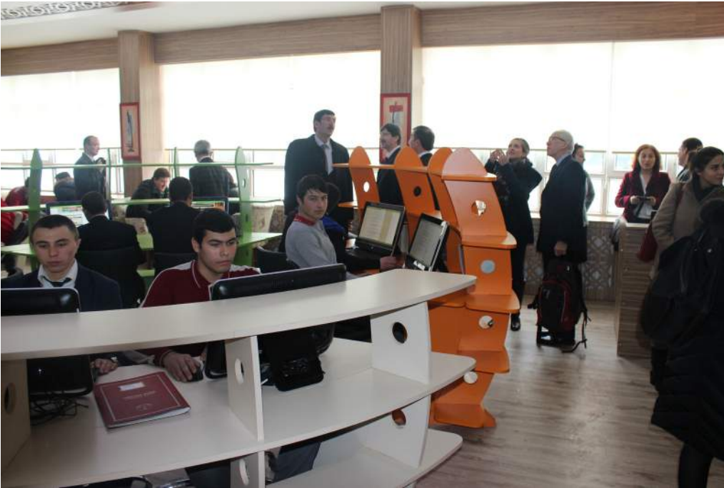
Z-Kütüphane Ziyareti - Afyon