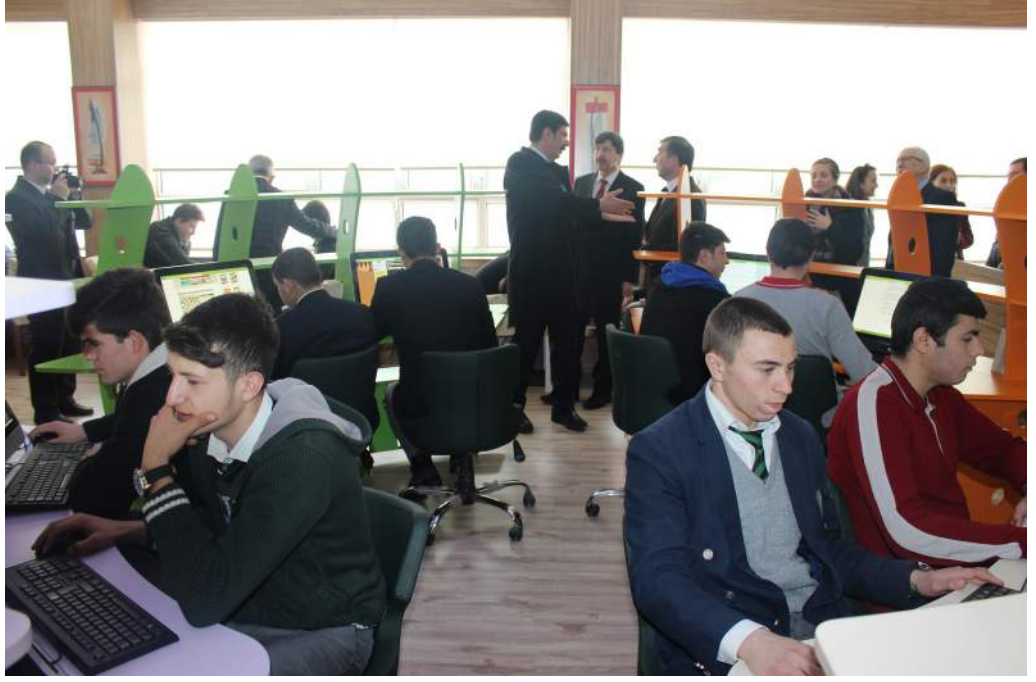
Z-Kütüphane Ziyareti – Afyon