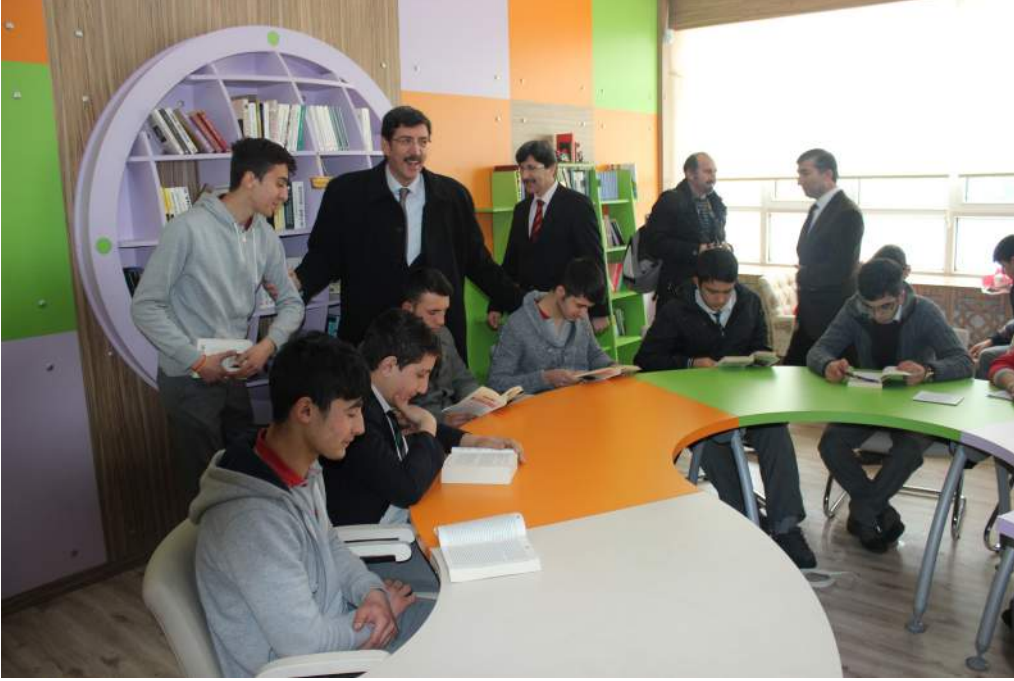
Z-Kütüphane Ziyareti - Afyon