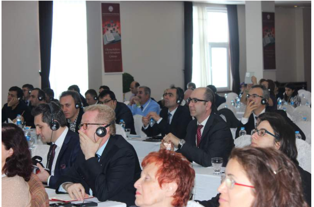
Çalıştay Katılımcıları -10