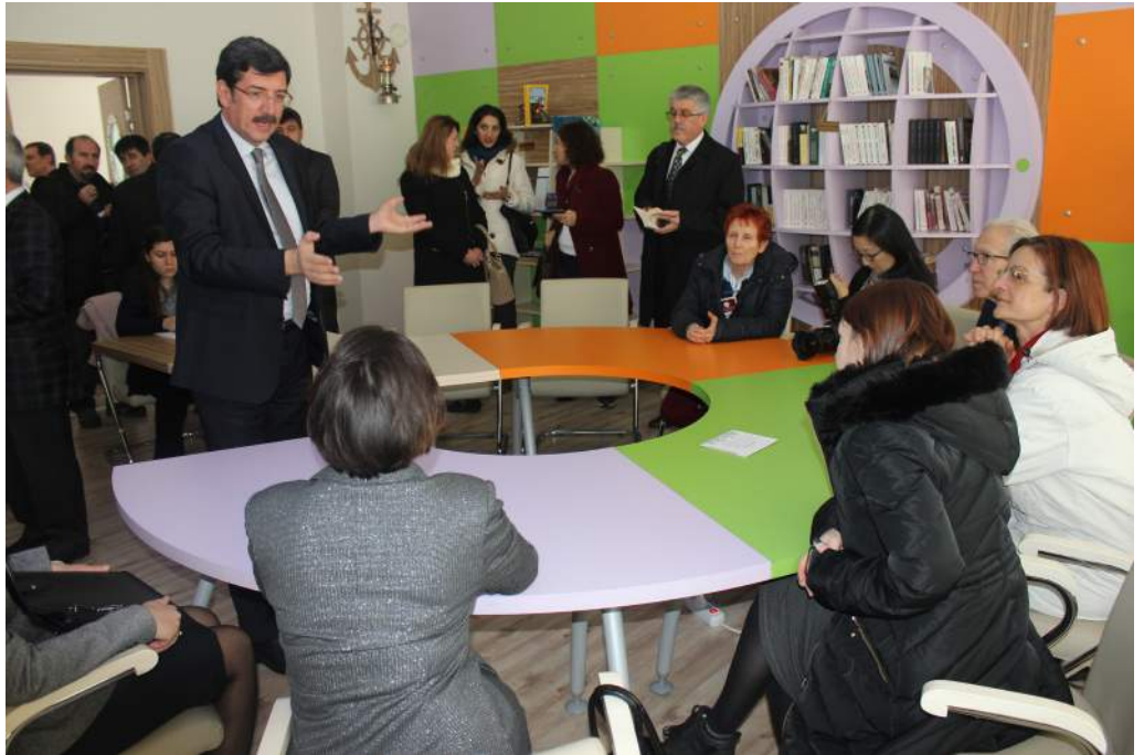
Z-Kütüphane Ziyareti – Afyon