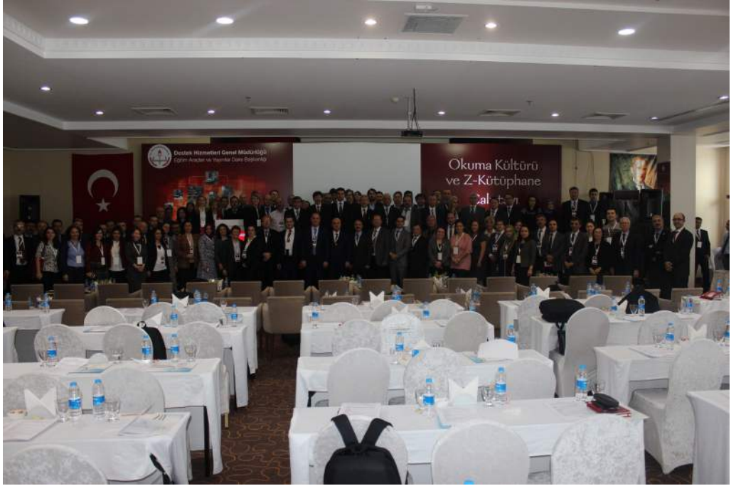
Çalıştay Aile Fotoğrafi