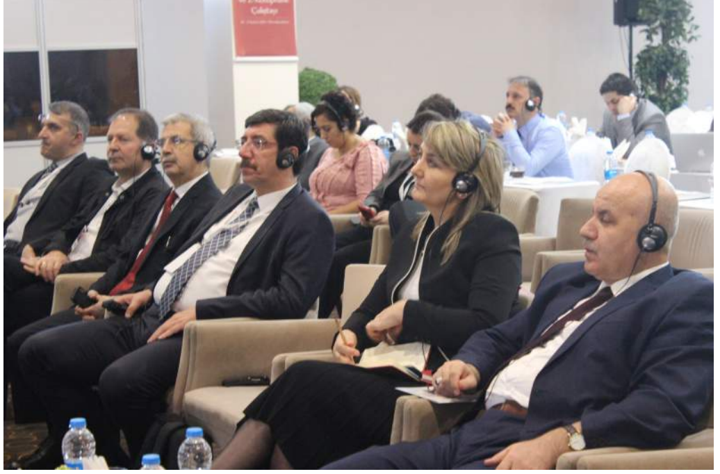
Çalıştay katılımcıları -12